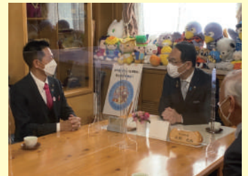
大野埼玉県知事と

■アプリ「吉川減災ナビ」を作成！①「防災行政無線の内容」や「避難情報」が届く②ハザードマップを見られる③避難所への経路が分かる、etc…。ぜひ、ご利用ください！